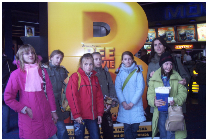
Uczniowie klas V w kinie na filmie „Film o pszczołach”

Po odwiedzinach w ambasadzie, tym razem już wszyscy poszliśmy do kina na film „Film o pszczołach” .