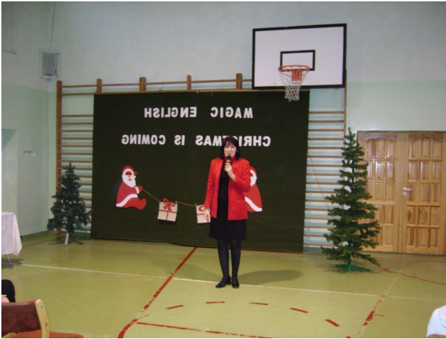
Pani dyrektor osobiście dziękowała uczestnikom projektu.