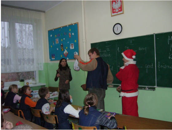
Pani Ania wraz ze swoją klasą odbiera prezenty.

6 grudnia to najweselszy i najśladzszy dzień w szkole.