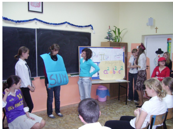
Uczniowie podczas przedstawienia.