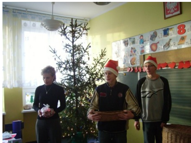
Pani Ala także rozdawała prezenty.