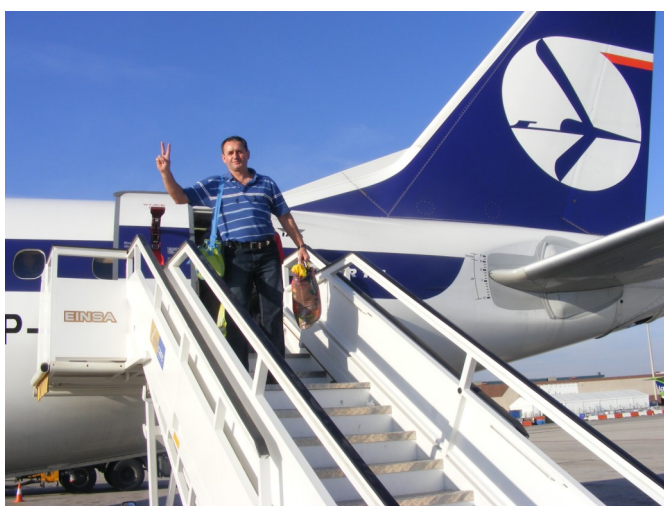
Już w Warszawie po wylądowaniu.

W środę, 28 listopada rano byłem już w szkole na zajęciach, ale myślami nadal w Barcelonie. Wspaniale byłoby tam jeszcze raz powrócić, naprawdę warto.