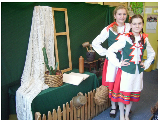
Dziewczęta z zespołu „Brzady” jak zawsze były ozdobą. Tutaj prezentują dawne naczynia kociewskie.

Cała uroczystość zakończyła się kawą i kuchem.