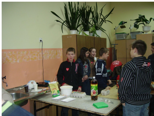
A ich koledzy z klas IPG kusili odwiedzających frytkami i hamburgerami.