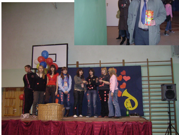
Nasz szkolny chór śpiewa piosenkę finałową.