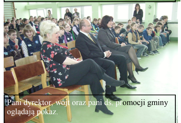
Pani dyrektor, wójt oraz pani ds. promocji gminy oglądają pokaz.