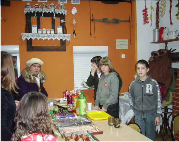
VI a zorganizował kafejkę, w której można było zjeść przepyszne ciasta domowej roboty oraz napić się kawki.