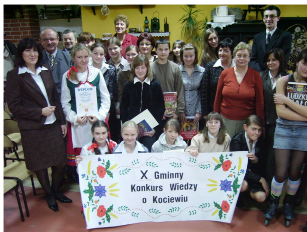
Uczestnicy turnieju i organizatorzy wraz z jury oraz gośćmi.