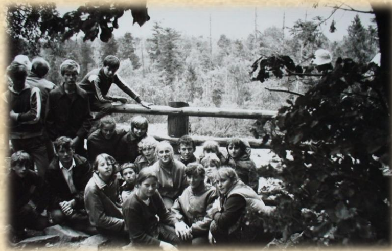
1986 Obóz wędrowny Góry Świętokrzyskie