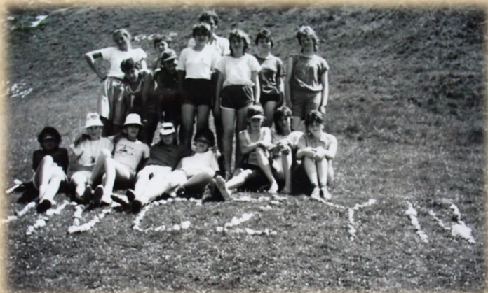
1989 Obóz wędrowny Jura