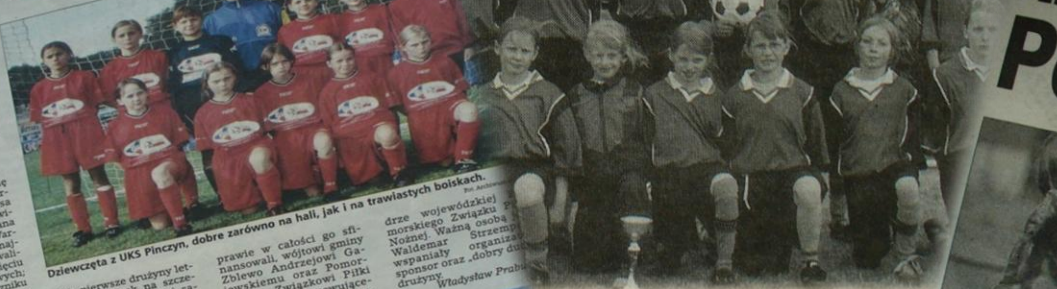
Dziewczęta z UKS Pinczyn, dobre zarówno na hali, jak i na trawiastych boiskach.

Dziewięć pierwszych występów w rozgrywkach makroregionalnych. Już w roku ubiegłym zdobyły tytuł mistrzyni województwa. W tym roku, podczas turnieju w Warszawie, zdobyły drugie miejsce. Wicemistrzynie kraju i nie wojny