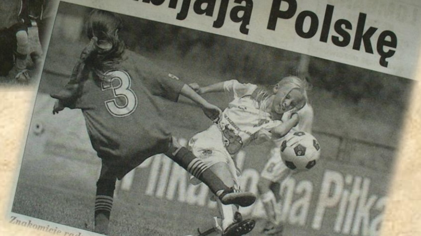
Znabomiecie radzą sobie